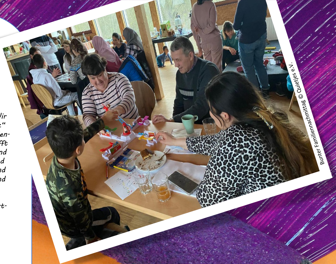
Bunter Familiennachmittag