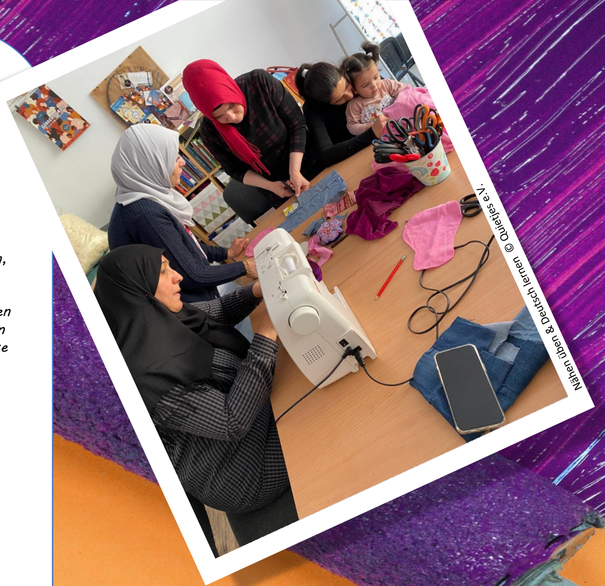
Nähen üben & Deutsch lernen

Initiative zur Förderung freier Kunst-, Kultur- und Bildungsprojekte im ländlichen Raum