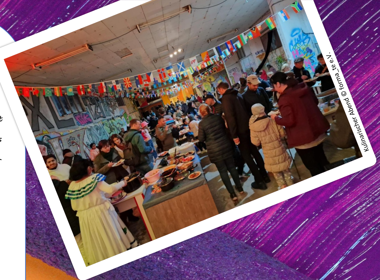
Kulinarischer Abend